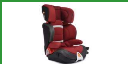
Автокресло группы III для детей массой 22-36 кг (возможно использование бустера)