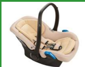
Автокресло группы 0+ для детей массой менее 13 кг