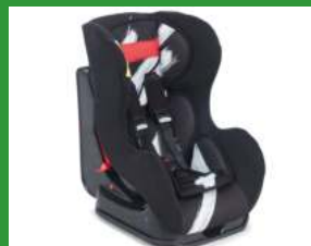
Автокресло группы I для детей массой 9-18 кг