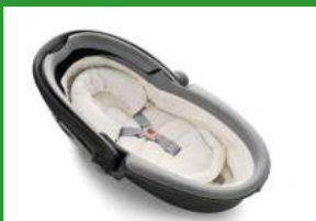
Автокресло «люлька» группы 0 для детей массой менее 10 кг

Детские удерживающие устройства подразделяют на 5 весовых групп: