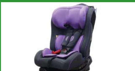
Автокресло группы II для детей массой 15-25 кг